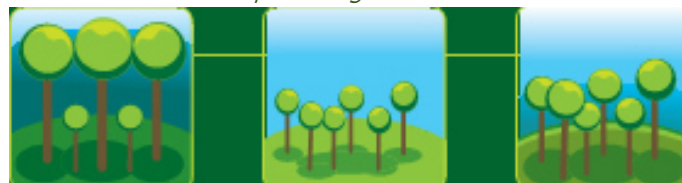
Une forêt d'arbres vieillissants