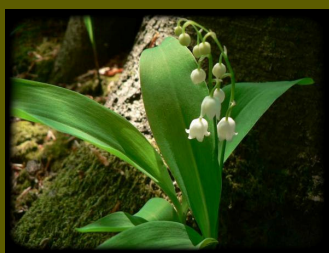
Muguet des bois