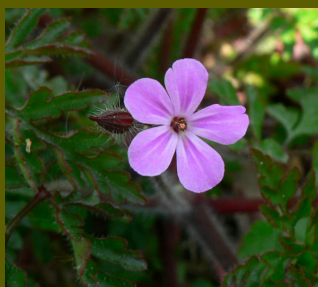
Géranium herbe à Robert

Contrairement aux animaux, les plantes ne peuvent pas bouger et subissent donc complètement les variations du milieu. Ainsi lumière, eau, mais aussi perturbations humaines permettent de comprendre pourquoi certaines plantes sont à un endroit précis.