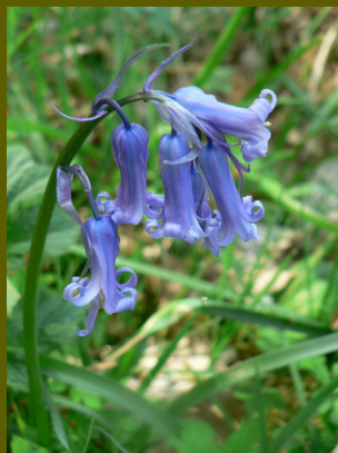
Jacinthe des bois