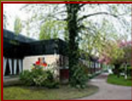
Maison des Associations de L'Isle-Adam