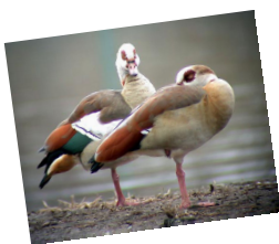
Couple d'Ouette d'Égypte

C'est un grand consommateur de plantes aquatiques. Depuis son arrivée sur le plan d'eau, les roselières ont disparu de même que les fauvelles aquatiques qui les peuplaient chaque printemps. L'hiver, il ronge les écorces au bas des troncs d'arbres. Les arbres des îles et des rives de l'étang meurent les uns après les autres. Cet animal est aussi porteur de salmonelles.