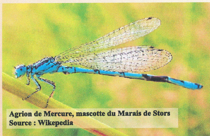
Agrion de Mercure, mascotte du Marais de Stors

Les opérations de 2014 (fauches, coupes de ligneux, entretien des chemins et mobiliers) ont permis de ré-ouvrir le Marais. Ces aménagements ont révélé des espèces spécifiques des milieux