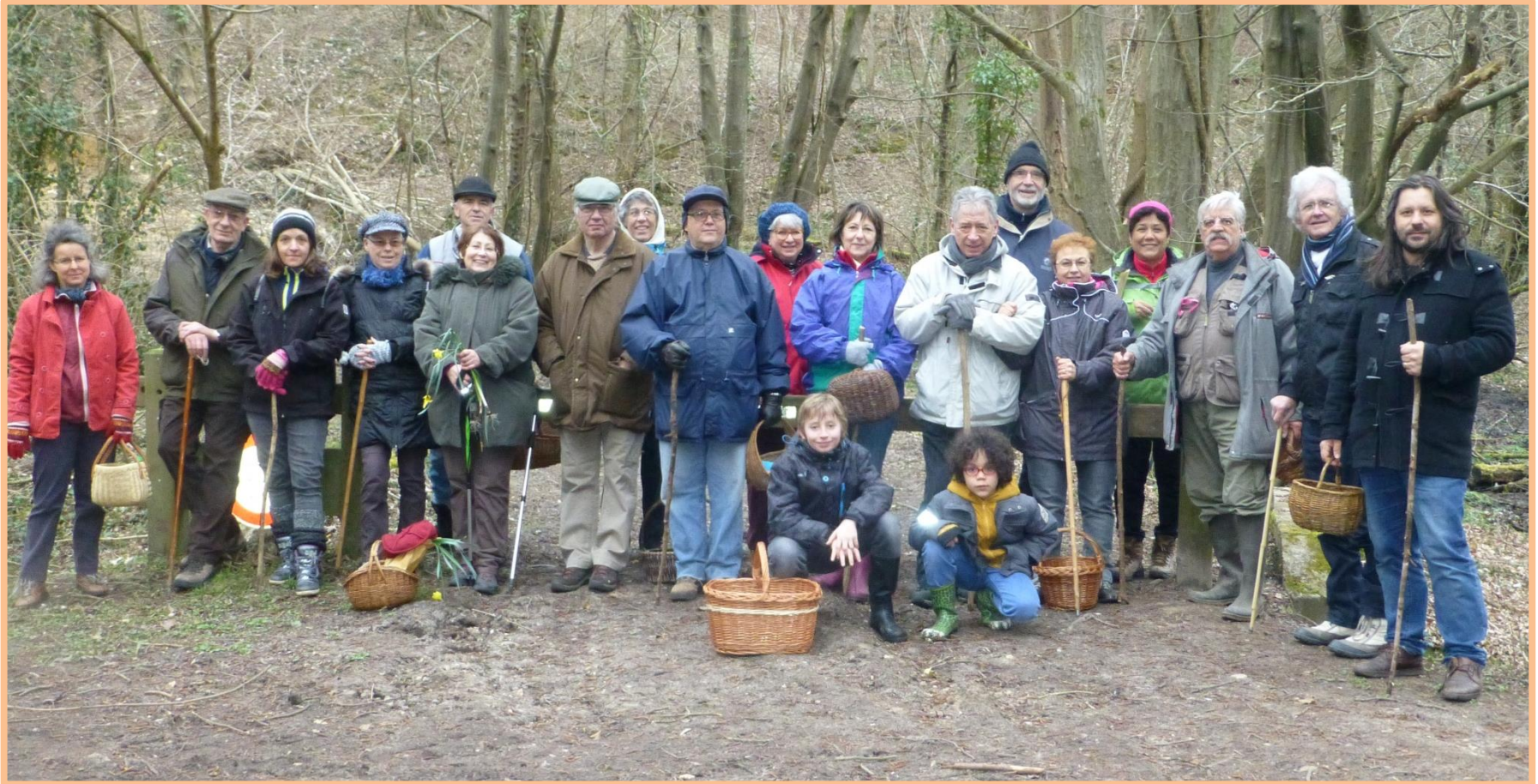
Sortie mycologique 14 mai 2016